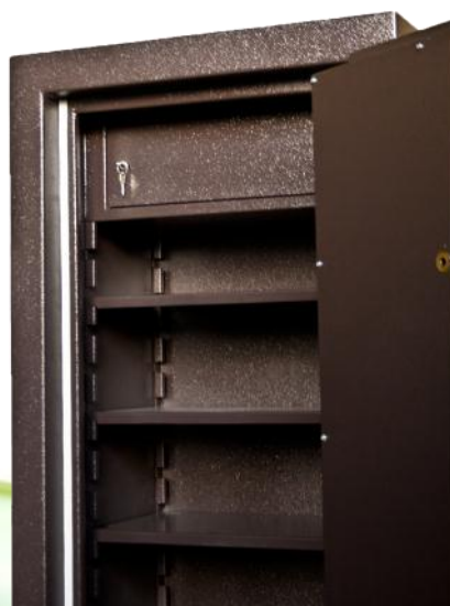
Pormenor compartimento interior