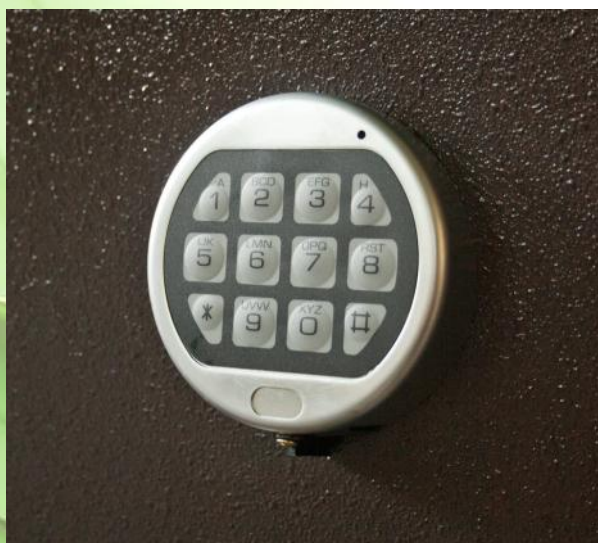
Pormenor Segredo LG Lagard Basic®